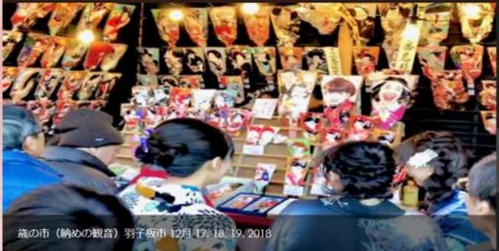
歳ノ市（納めの観音）羽子板市 12月 17, 18, 19, 2018