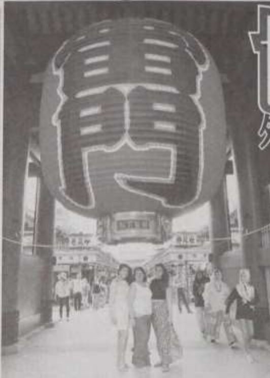
浅草の観光名所、浅草寺の雷門。右に浅草橋が見える。

外国人観光客も関係メディアの注目を集めている。イベントは関係メディアの注目を集めている。イベントは関係メディアの注目を集めている。イベントは関係メディアの注目を集めている。