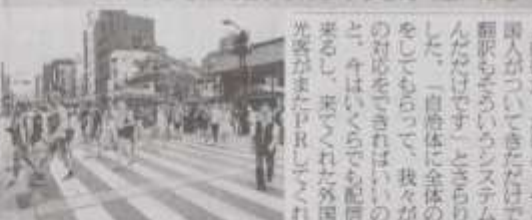
浅草の観光名所、浅草寺の雷門。右に浅草橋が見える。

外国人観光客も関係メディアの注目を集めている。イベントは関係メディアの注目を集めている。イベントは関係メディアの注目を集めている。イベントは関係メディアの注目を集めている。