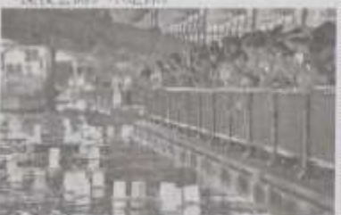
浅草の観光名所、浅草寺の雷門。右に浅草橋が見える。

◆ワインバル「ルガール」 台東区浅草2の14の7。☎03・6876・3025。午後2時～深夜2時。不定休。